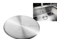
CapFlow Läs mera >>