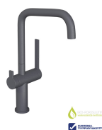
LAPETEK LINO-A Lue lisää >>