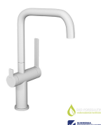
LAPETEK LINO-A Lue lisää >>